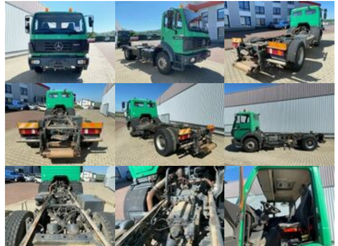
Mercedes-Benz SK 1924 L 4x2 SK 1924 L 4x2