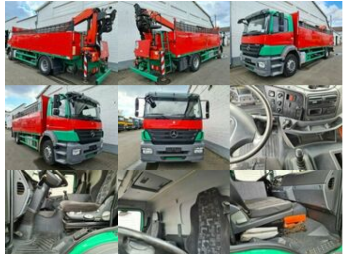
Mercedes-Benz Axor 1833L 4x2 Axor 1833L, mit Kran Palfinger PK 12001 L

Preis (brutto): 29.631,00 € Gesetzl. MwSt. 19%: 4.731,00 €