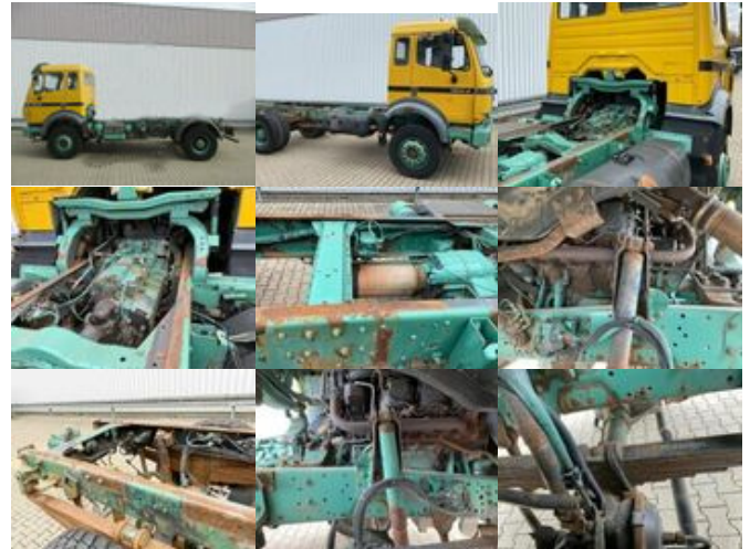
Mercedes-Benz SK 1824 AK 4x4 SK 1824 AK 4x4

Preis (brutto): 23.681,00 € Gesetzl. MwSt. 19%: 3.781,00 €