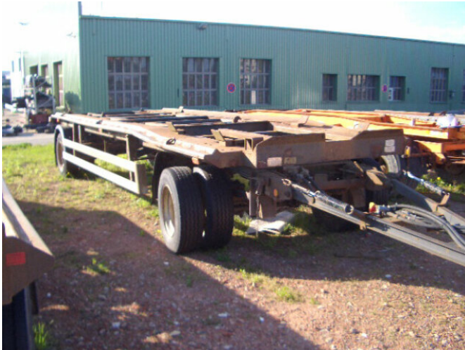
GEORG, NEIT. GLI 12-51KO Georg GLI 12-51 KO

Preis (brutto): 3.451,00 € Gesetzl. MwSt. 19%: 551,00 €