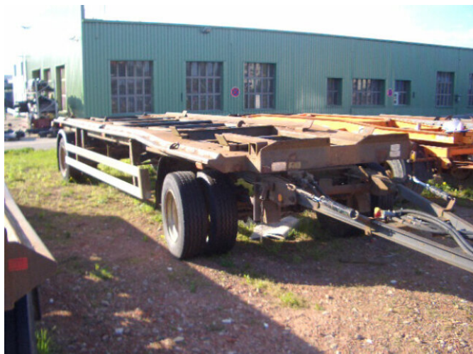
GEORG, NEIT. GLI 12-51KO Georg GLI 12-51 KO

Preis (brutto): 3.451,00 € Gesetzl. MwSt. 19%: 551,00 €