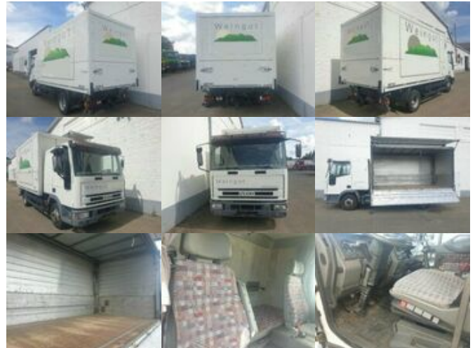
Iveco Euro Cargo ML 75E14 4x2 Euro Cargo ML 75E14 4x2 Getränkewagen, 6-Zylinder-Motor

Preis (brutto): 5.831,00 € Gesetzl. MwSt. 19%: 931,00 €