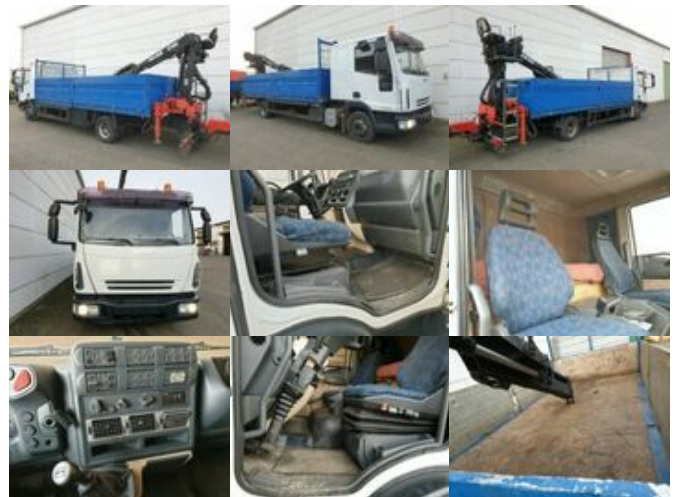
Iveco EuroCargo 80E 18 4x2 Euro Cargo ML 80 E 18, Hiab Kran 060-2