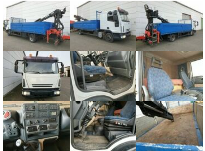
Iveco EuroCargo 80E 18 4x2 Euro Cargo ML 80 E 18, Hiab Kran 060-2

Preis (brutto): 15.351,00 € Gesetzl. MwSt. 19%: 2.451,00 €