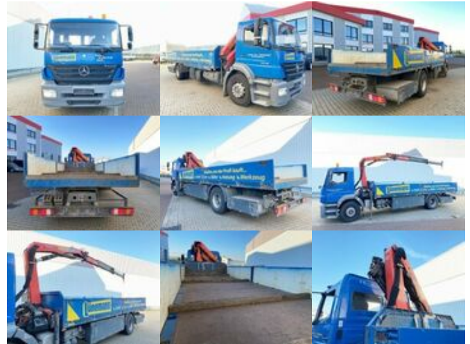
Mercedes-Benz Axor 1828 L 4x2 Axor 1828 L 4x2 mit Kran Palfinger PK 9501, Funk

Preis (brutto): 30.821,00 € Gesetzl. MwSt. 19%: 4.921,00 €