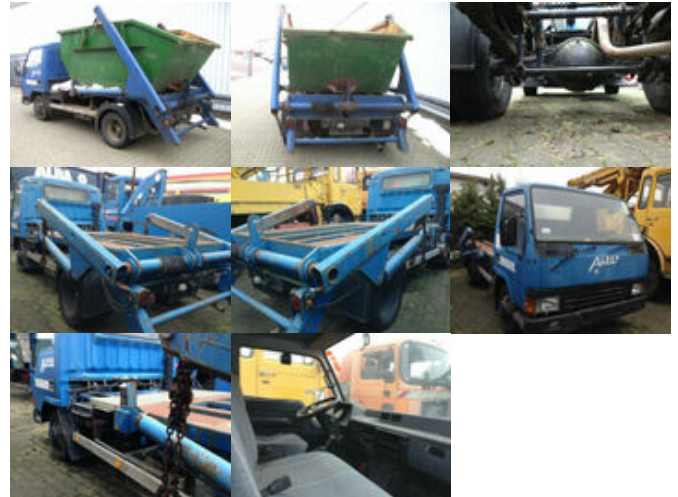
Mitsubishi Canter 4x2

Preis (brutto): 4.641,00 € Gesetzl. MwSt. 19%: 741,00 €