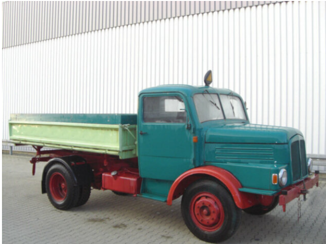
IFA-AUTOMOBILW. - H3A 4x2 IFA H3A 4x2