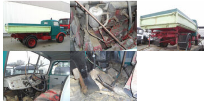
IFA-AUTOMOBILW. - H3A 4x2 IFA H3A 4x2

Preis: 9.000,00 € MwSt. nicht ausweisbar