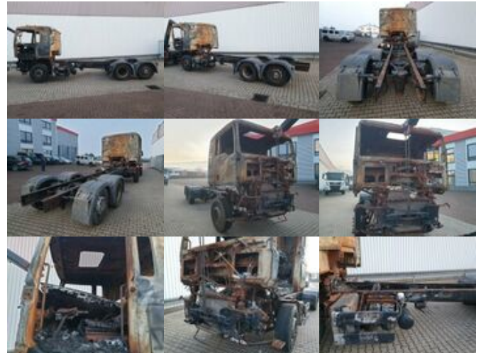
MAN TGA 26.440 6x2 BL Brandschaden TGA 26.440 6x2 BL Brandschaden

Preis (brutto): 5.831,00 € Gesetzl. MwSt. 19%: 931,00 €