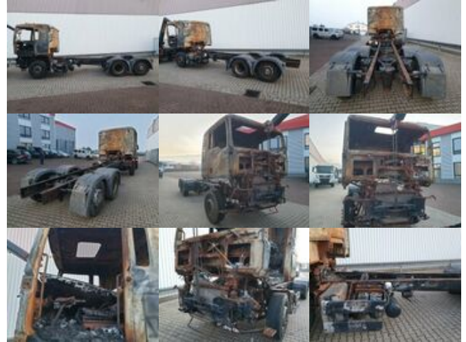
MAN TGA 26.440 6x2 BL Brandschaden TGA 26.440 6x2 BL Brandschaden

Preis (brutto): 5.831,00 € Gesetzl. MwSt. 19%: 931,00 €