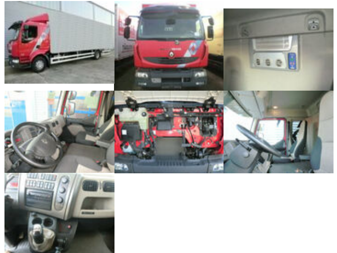
Renault Midlum 220 DXi 4x2 Midlum 220 DXi 4x2 mit Kran Palfinger PK 11001

Preis (brutto): 54.621,00 € Gesetzl. MwSt. 19%: 8.721,00 €