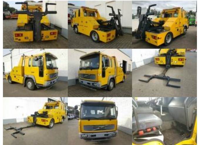
Volvo FL 612 L FL 612 L, Abschleppwagen Hubbrille 3 to