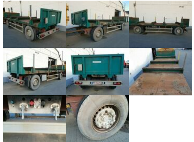
HOENKHAUS Anhänger Plateau Anhänger Pritsche Plateau, Rungen, 3x vorh.

Preis (brutto): 4.165,00 € Gesetzl. MwSt. 19%: 665,00 €