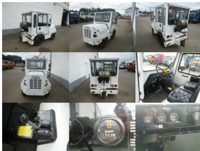
Sonstige Hersteller Tiger TC-50 Tiger TC 50, Zugmaschine

Preis (brutto): 4.641,00 € Gesetzl. MwSt. 19%: 741,00 €