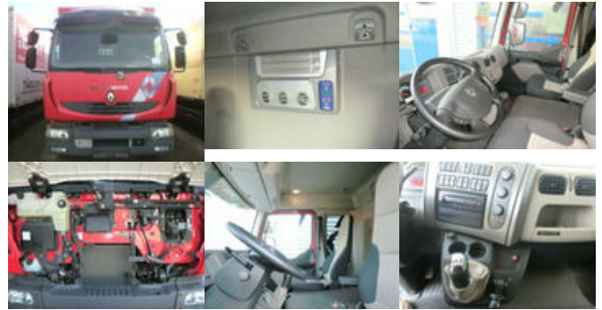
Renault Midlum 220 DXi 4x2 Midlum 220 DXi 4x2