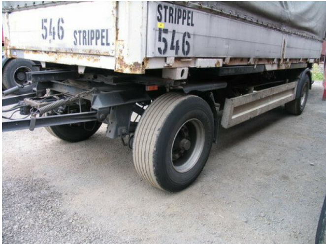
Krone AZW 18

Preis (brutto): 2.737,00 € Gesetzl. MwSt. 19%: 437,00 €