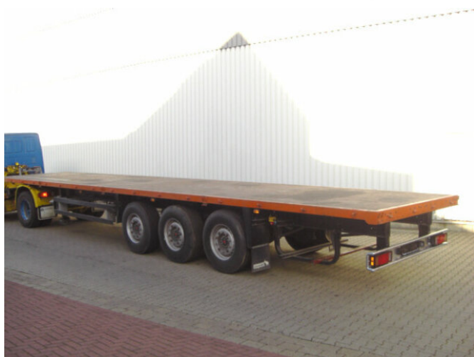
Schmitz SPR 24 SPR 24. 20x VORHANDEN!

Preis (brutto): 8.211,00 € Gesetzl. MwSt. 19%: 1.311,00 €