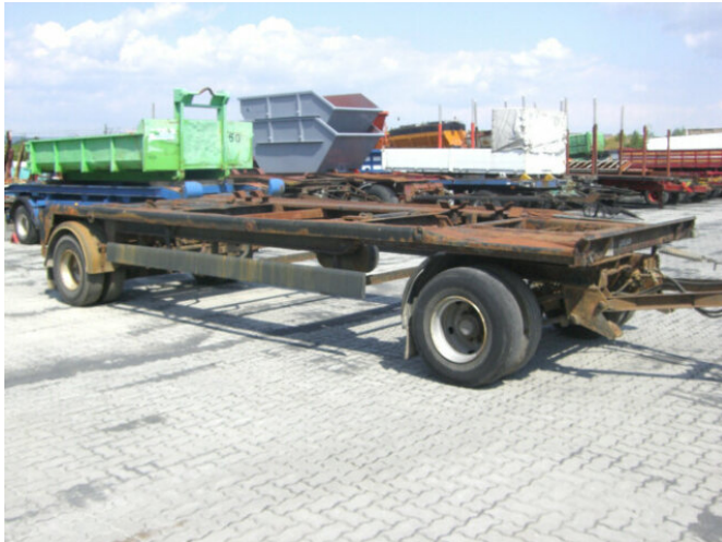
KOMPENHANS KHM 9105 KOMPENHANS KHM 9105

Preis (brutto): 2.261,00 € Gesetzl. MwSt. 19%: 361,00 €