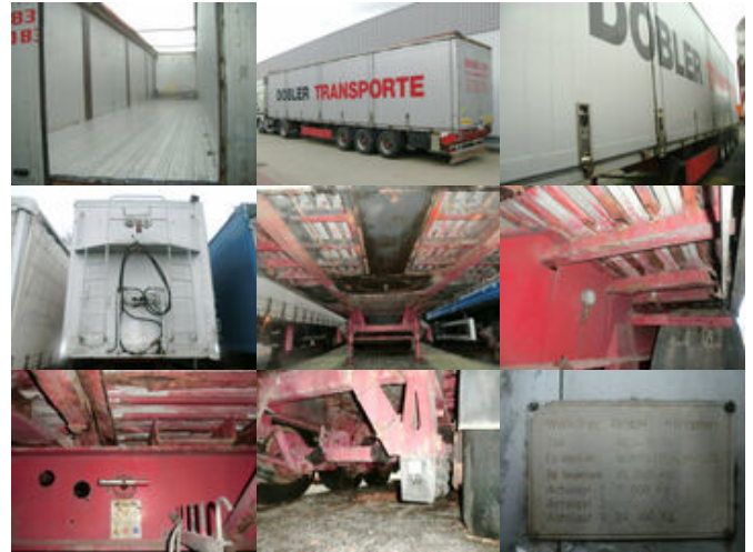
WALKLINER WLS 35/24 WALKLINER WLS 35/24, Walkingfloor mit Klappen linke Seite ca. 87m 3

Preis (brutto): 9.401,00 € Gesetzl. MwSt. 19%: 1.501,00 €