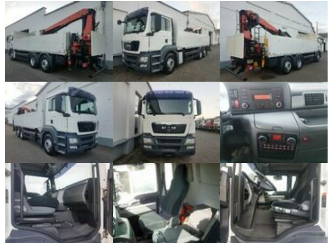
MAN TGS 26.360 LL/6x2/4 TGS26.360LL 6x2,Baustoff,Kran Palfinger PK24001

Preis (brutto): 47.481,00 € Gesetzl. MwSt. 19%: 7.581,00 €