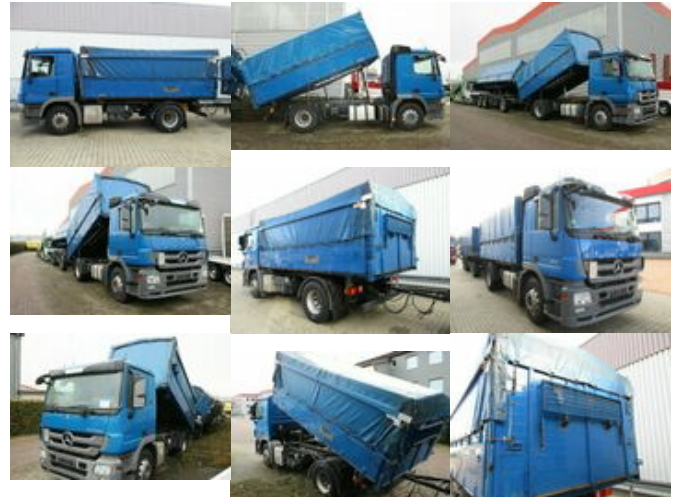
Mercedes-Benz Actros 1841L 4x2 1841L 4x2 Lück Getreidekipper, Retarder, MP3, 2x VORH.!

Preis (brutto): 29.631,00 € Gesetzl. MwSt. 19%: 4.731,00 €