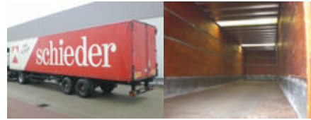
Spier SLG 2/90 SPIER SLG 2/90, Möbelaufleger, 80 cbm

Preis (brutto): 3.451,00 € Gesetzl. MwSt. 19%: 551,00 €