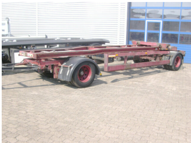
EGGERS HWT 18ZRL/1S EGGERS 2-A-Abrollanhänger, 7,5m Cont. Schlitten

Preis (brutto): 3.451,00 € Gesetzl. MwSt. 19%: 551,00 €