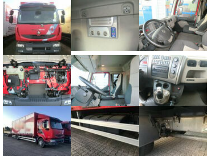
Renault Midlum 220 DXi 4x2 Chassi Länge 7,5 m

Preis (brutto): 35.581,00 € Gesetzl. MwSt. 19%: 5.681,00 €