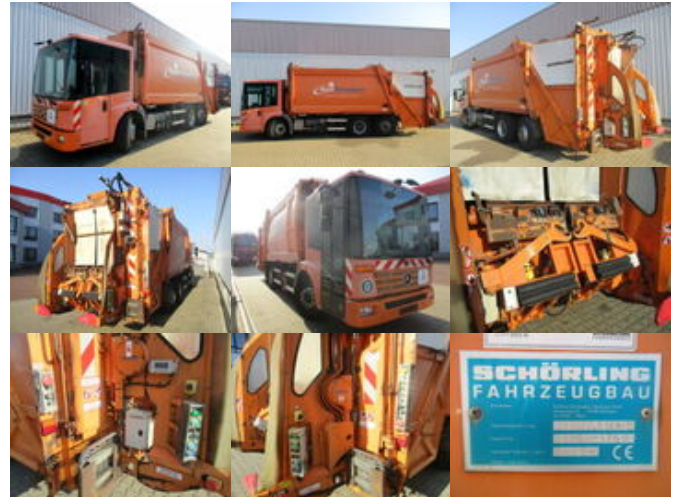
Mercedes-Benz Eonic 2628L/NLA6x2/4 Eonic 2628L 6x2-4 Schörling 3R11 22.5, Terberg Schüttung