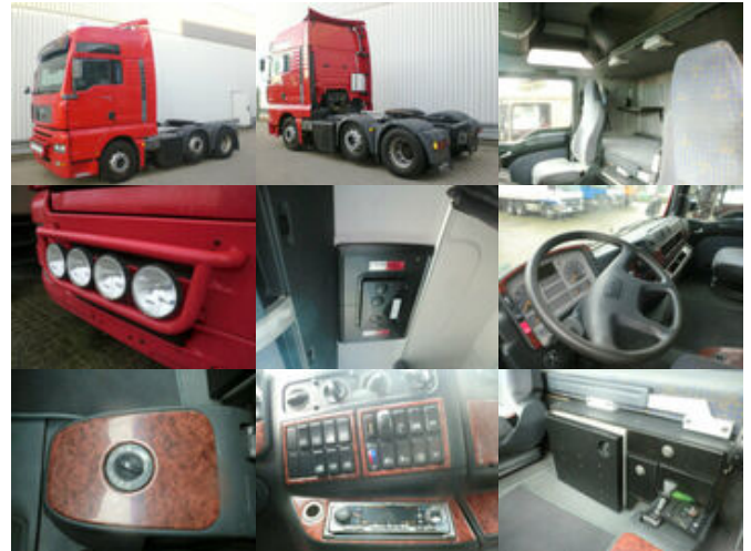
MAN TGA 26.463 FVLS 6x2