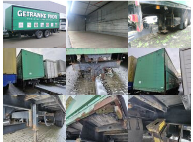
Koegel - ZFHB 18 ZFHB 18, Böse Getränkekofer, BÄR LBW

Preis (brutto): 4.641,00 € Gesetzl. MwSt. 19%: 741,00 €