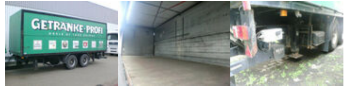
Koegel - ZFHB 18 ZFHB 18, Böse Getränkekoffer, BÄR LBW

Preis (brutto): 4.641,00 € Gesetzl. MwSt. 19%: 741,00 €