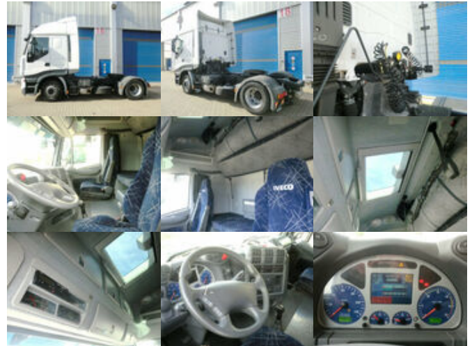
Iveco Stralis 440S45T/P 4x2 Stralis 440S45T/P 4x2