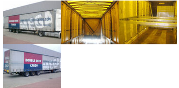
Hoffmann HSE - HSE, Mega, Jumbo

Preis (brutto): 4.641,00 € Gesetzl. MwSt. 19%: 741,00 €