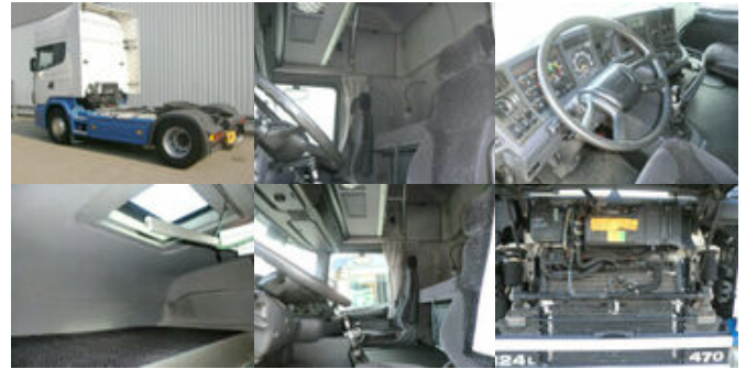
Scania 124 R 470 4x2 124R470 4x2, Kipphydraulik, 6 Zylinder

Preis (brutto): 11.781,00 € Gesetzl. MwSt. 19%: 1.881,00 €