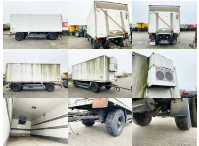
Rohr KA 18 ROHR KA 18

Preis (brutto): 3.451,00 € Gesetzl. MwSt. 19%: 551,00 €