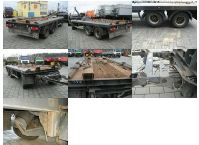
S-K-E-L-M-S-K ASM PA 24 SKELMSK ASM PA24, 2x Anh. f. Absetzcontainer

Preis (brutto): 9.401,00 € Gesetzl. MwSt. 19%: 1.501,00 €