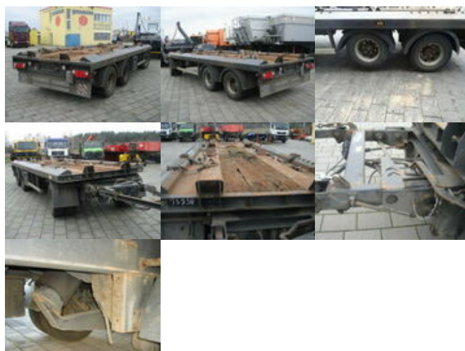
S-K-E-L-M-S-K ASM PA 24 SKELMSK ASM PA24, 2x Anh. f. Absetzcontainer

Preis (brutto): 9.401,00 € Gesetzl. MwSt. 19%: 1.501,00 €