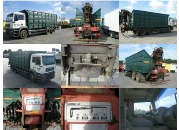
MAN TGA 26.413 BB 6x4 TGA 26.413 BB 6x4 mit Heckkran Jonsered 1020

Preis (brutto): 17.731,00 € Gesetzl. MwSt. 19%: 2.831,00 €