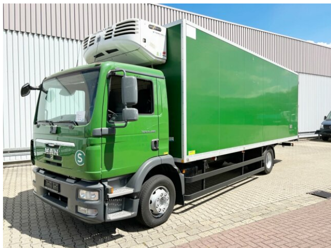
MAN TGM 15.290 4x2 BL TGM 15.290 4x2 BL, Tiefkühlkoffer