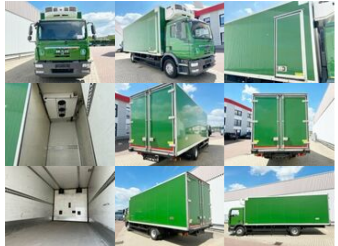
MAN TGM 15.290 4x2 BL TGM 15.290 4x2 BL, Tiefkühlkoffer

Preis (brutto): 41.531,00 € Gesetzl. MwSt. 19%: 6.631,00 €