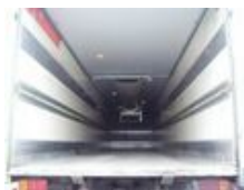
Ackermann AS-F 20/13.6 ZI.-ZG

Preis (brutto): 8.211,00 € Gesetzl. MwSt. 19%: 1.311,00 €