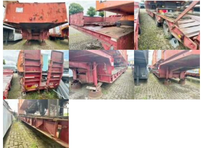
Kaiser - SANH Tiefflader KAISER

Preis (brutto): 8.211,00 € Gesetzl. MwSt. 19%: 1.311,00 €