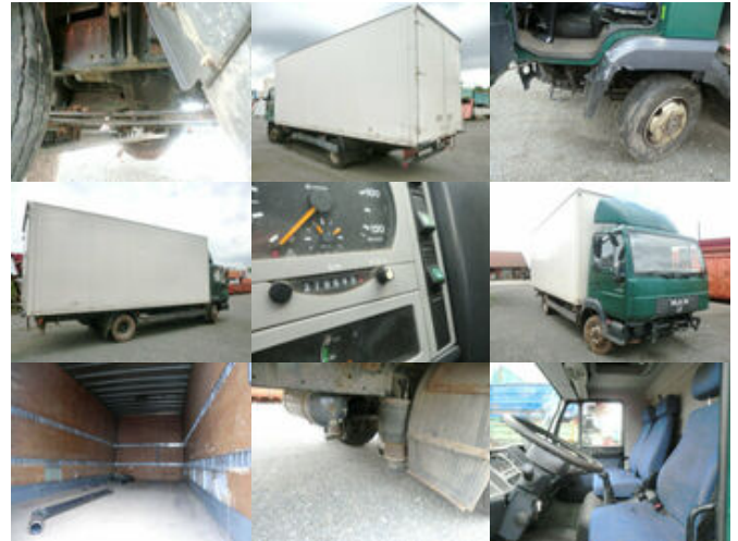
MAN L33 8.180 C 4x2 L33 8.180 C 4x2, Unfallfahrzeug mit Frontalschaden

Preis (brutto): 3.451,00 € Gesetzl. MwSt. 19%: 551,00 €