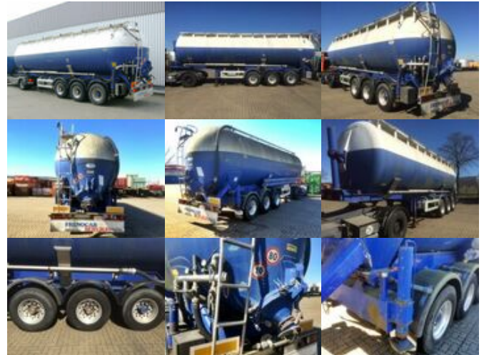
Mistrall SAnh Silo MISTRAL Kippsilo, ca. 49m 3

Preis (brutto): 16.541,00 € Gesetzl. MwSt. 19%: 2.641,00 €