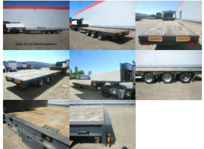
Schwarz Müller STP 3/ZV-N 3-Achse nachlaufgelenkt, mit 6x Twist Lock