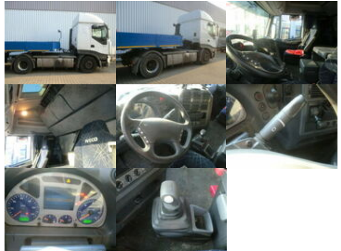
Iveco Stralis 440S43T/P 4x2 Stralis 440S43T/P 4x2, Kipphydraulik

Preis (brutto): 11.781,00 € Gesetzl. MwSt. 19%: 1.881,00 €