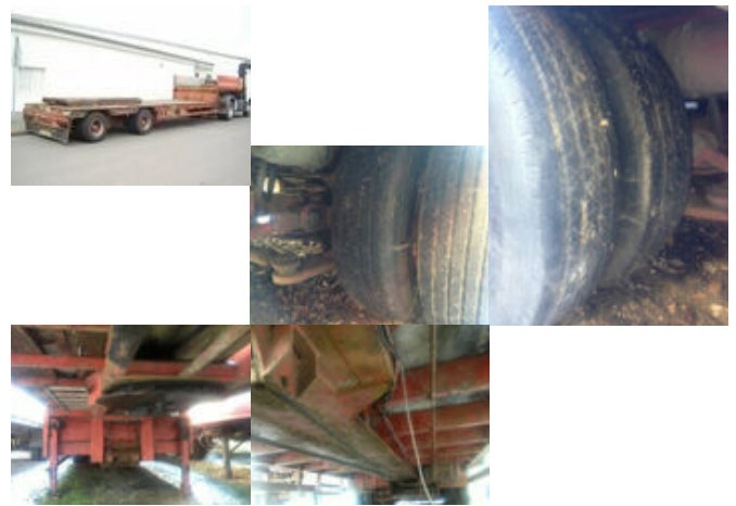
Goldhofer STPA T2-22/80A zwangsgelenkt STPA T2-22/80A zwangsgelenkt

Preis (brutto): 11.781,00 € Gesetzl. MwSt. 19%: 1.881,00 €