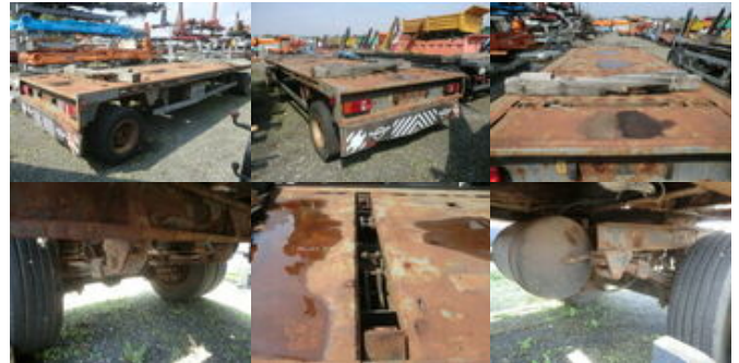
BEROE-LEISINGER AP 18 BEROE-LEISINGER AP18

Preis (brutto): 2.261,00 € Gesetzl. MwSt. 19%: 361,00 €