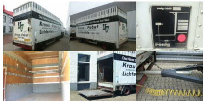
SOMMER AC 160 TVL Sommer AC 160 TL, Möbelkoffernhänger, LBW, 55cbm

Preis (brutto): 4.641,00 € Gesetzl. MwSt. 19%: 741,00 €