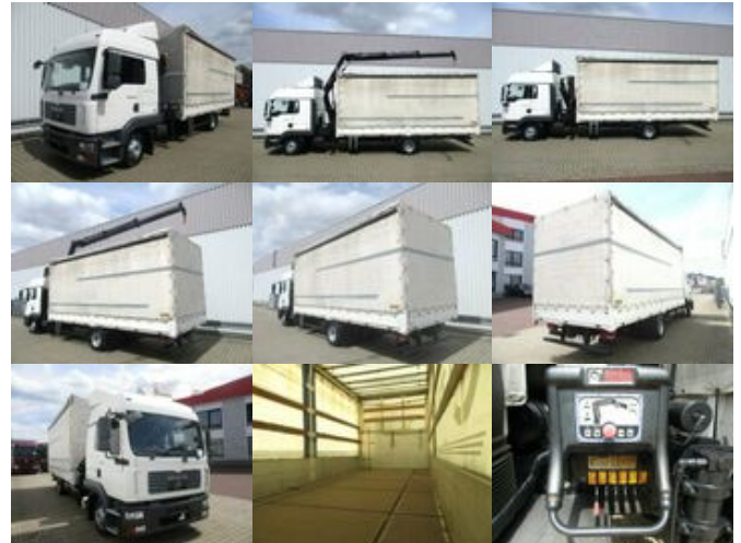
MAN TGL 12.240 BL 4x2 TGL 12.240BL 4x2, mit Kran Hiab 088 mit Funk

Preis (brutto): 27.251,00 € Gesetzl. MwSt. 19%: 4.351,00 €