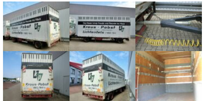
SOMMER - - Sommer AC 160 TL, Möbelkoffieranhänger, LBW, 55cbm

Preis (brutto): 4.165,00 € Gesetzl. MwSt. 19%: 665,00 €