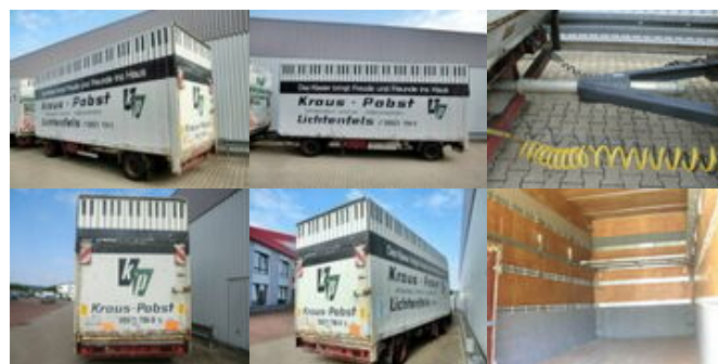
SOMMER - - Sommer AC 160 TL, Möbelkofferanhänger, LBW, 55cbm

Preis (brutto): 4.165,00 € Gesetzl. MwSt. 19%: 665,00 €