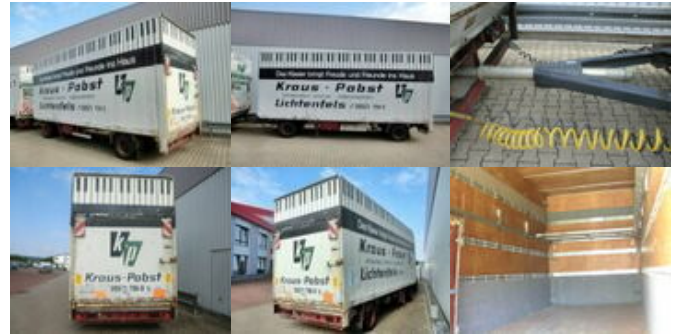
SOMMER - - Sommer AC 160 TL, Möbelkofferanhänger, LBW, 55cbm

Preis (brutto): 4.165,00 € Gesetzl. MwSt. 19%: 665,00 €