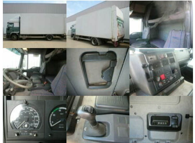
Iveco EuroTech 190E40 4x2 Euro Tech 190E40, Möbelkoffer, 49 cbm

Preis (brutto): 10.710,00 € Gesetzl. MwSt. 19%: 1.710,00 €