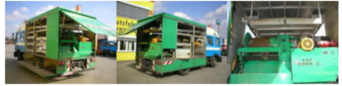
MAN M02 12.232 4x2 Spülwagen