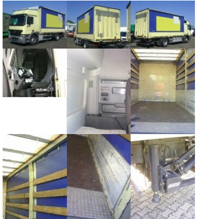
Mercedes-Benz Actros 1846L 4x2, MBB LBW 2,5 to.

Preis (brutto): 29.631,00 € Gesetzl. MwSt. 19%: 4.731,00 €