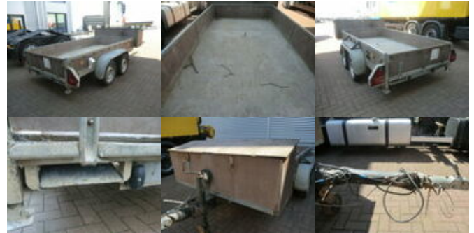
LEIBING - - LEIBING, 2.000 kg

Preis (brutto): 2.023,00 € Gesetzl. MwSt. 19%: 323,00 €