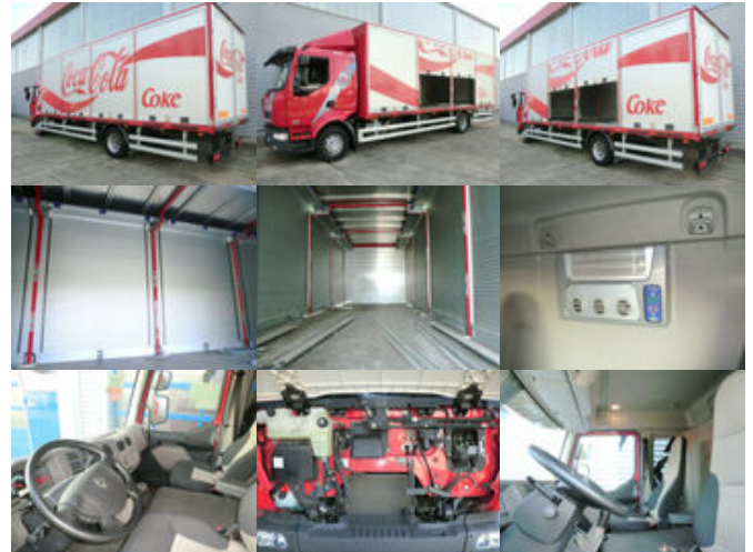
Renault Midlum 220 DXi 4x2